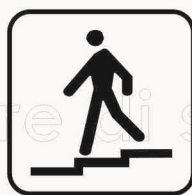
Figura II 127 Art. 125 SOTTOPASSAGGIO