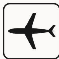
Figura II 116 Art. 125 AEROPORTO