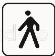
Figura II 125 Art. 125 ZONA PEDONALE