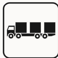
Figura II 140/a Art. 125 TRASP. CONTAINER