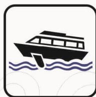
Figura II 121 Art. 125 ALISCAFO