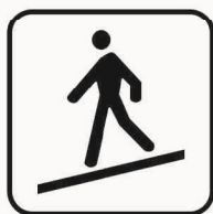
Figura II 129 Art. 125 RAMPA