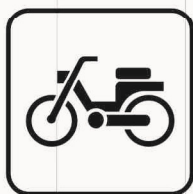
Figura II 132 Art. 125 CICLOMOTORE