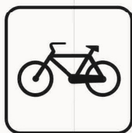
Figura II 131 Art. 125 BICICLETTA