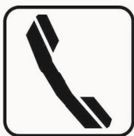
Figura II 107 Art. 125 TELEFONO