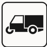
Figura II 135 Art. 125 MOTOCARRO