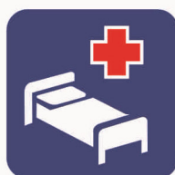
Figura II 104 Art. 125 OSPEDALE