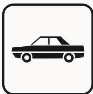
Figura II 136 Art. 125 AUTO