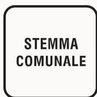
Figura II 102 Art. 125 COMUNE