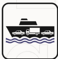
Figura II 120 Art. 125 TRAGHETTO