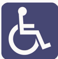
Figura II 130 Art. 125 INVALIDO