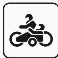
Figura II 134 Art. 125 MOTOCARROZZETTA