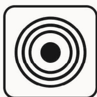
Figura II 100 Art. 125 CENTRO