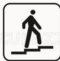
Figura II 128 Art. 125 SOPRAPASSAGGIO