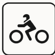
Figura II 133 Art. 125 MOTOCICLO