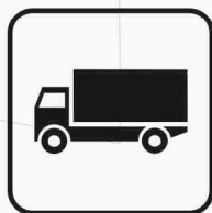
Figura II 137 Art. 125 AUTOCARRO