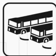
Figura II 122 Art. 125 AUTOSTAZIONE