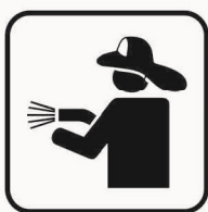
Figura II 112 Art. 125 VIGILI DEL FUOCO