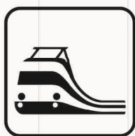
Figura II 114 Art. 125 STAZIONE