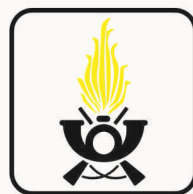
Figura II 110/b Art. 125 GUARDIA DI FINANZA