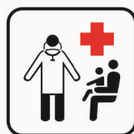
Figura II 105 Art. 125 AMBULATORIO