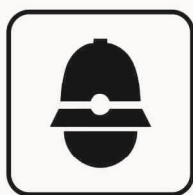
Figura II 111 Art. 125 POLIZIA MUNICIPALE