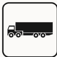
Figura II 139 Art. 125 AUTOARTICOLATO