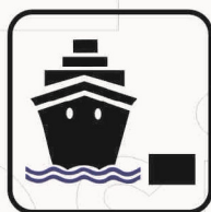
Figura II 119 Art. 125 PORTO