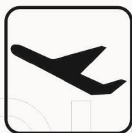
Figura II 117 Art. 125 PARTENZE