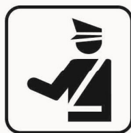
Figura II 110/a Art. 125 POLIZIA