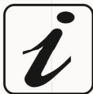
Figura II 108 Art. 125 INFORMAZIONI