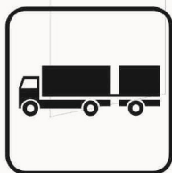
Figura II 138 Art. 125 AUTOTRENO