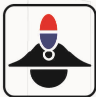
Figura II 109 Art. 125 CARABINIERI