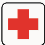
Figura II 103 Art. 125 PRONTO SOCCORSO