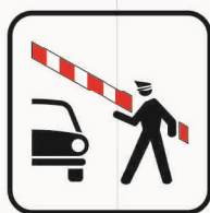
Figura II 113 Art. 125 FRONTIERA