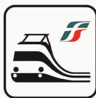
Figura II 115 Art. 125 STAZIONE FS