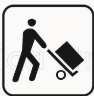
Figura II 124 Art. 125 CARICO E SCARICO