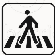
Figura II 126 Art. 125 ATTRAV. PEDONALE