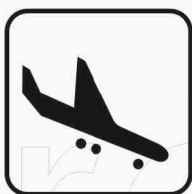
Figura II 118 Art. 125 ARRIVI