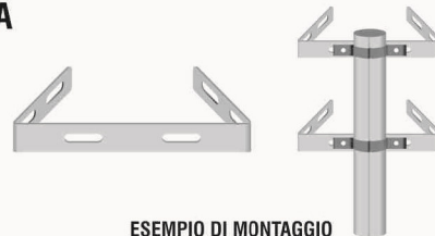
ESEMPIO DI MONTAGGIO