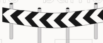
ESEMPIO DI APPLICAZIONE SU 4 PALI TARGA FLESSIBILE ALLUMINIO PIANO 25/10 FIGURA 466